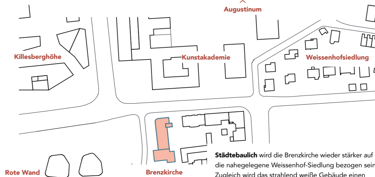
Städtebaulich wird die Brennkirche wieder stärker auf die nahegelegene Weissenhof-Siedlung bezogen sein. Zugleich wird das strahlend weiße Gebäude einen leuchtenden Anziehungspunkt im Quartier zwischen Augustinum, Killesberghöhe, Roter Wand und Kunstakademie setzen.