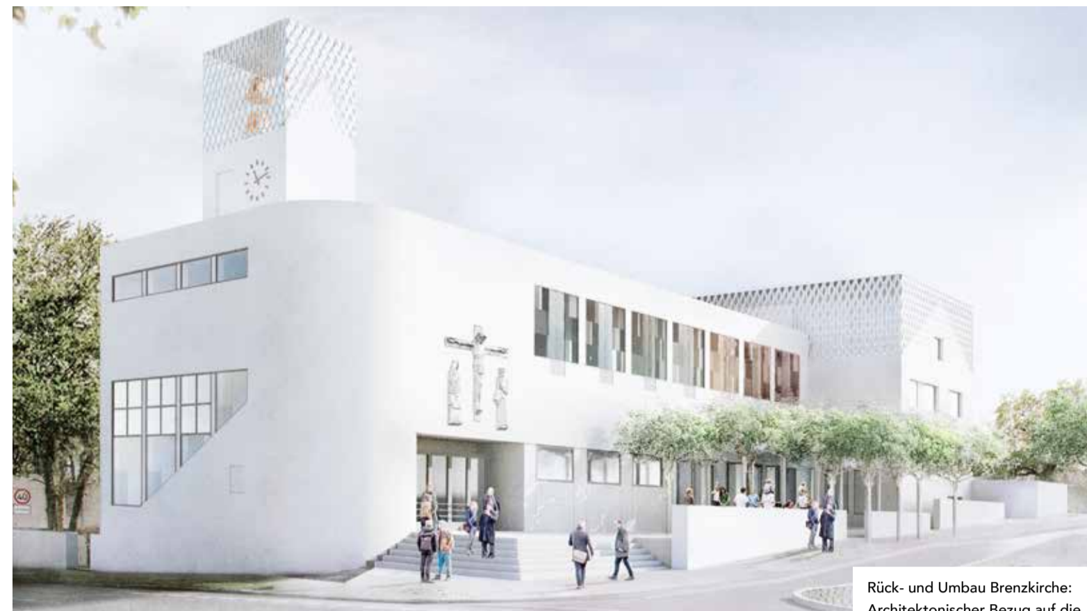
Rück- und Umbau Brenzkirche: Architektonischer Bezug auf die Weissenhof-Siedlung.