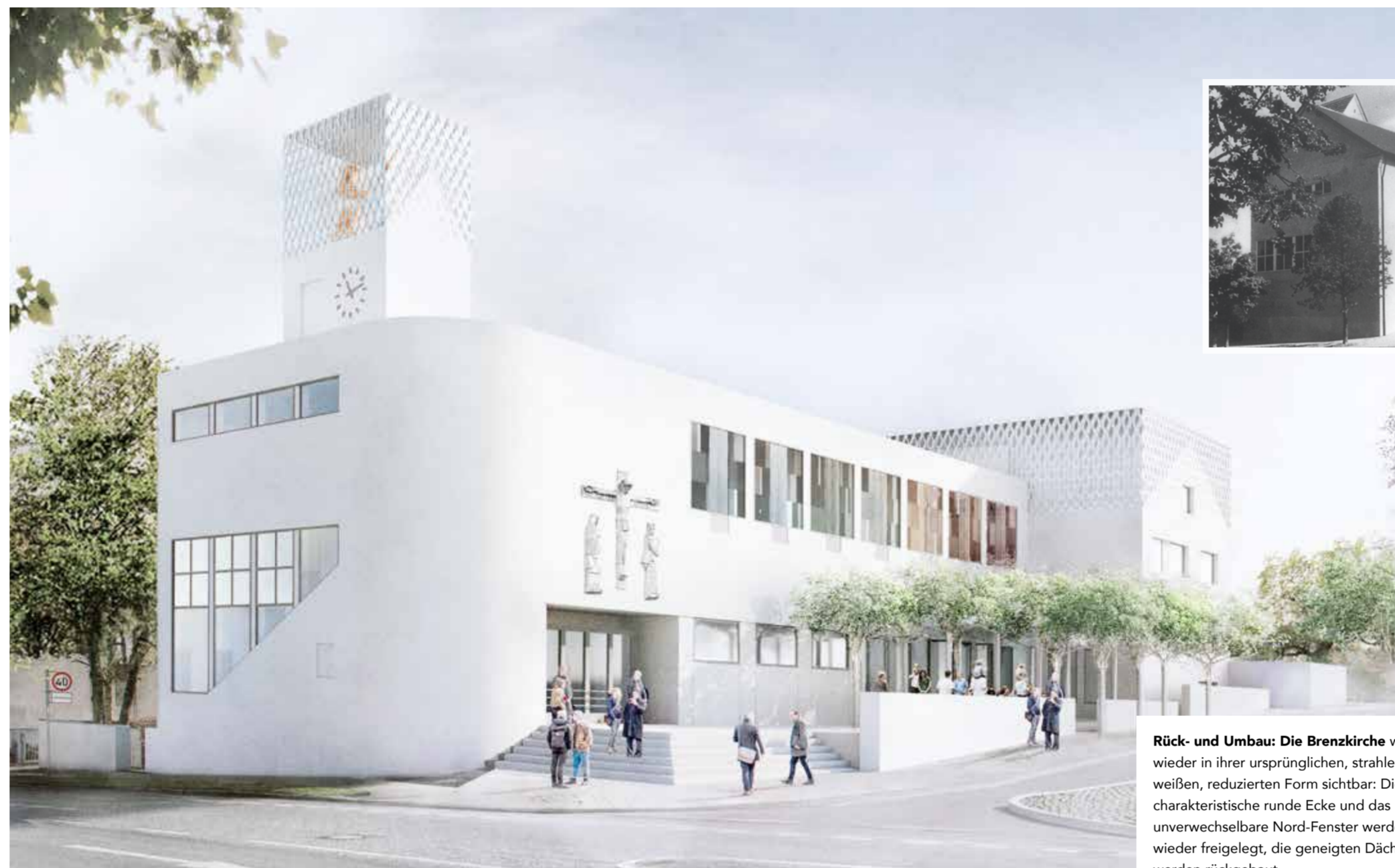
Rück- und Umbau: Die Brennkirche wird wieder in ihrer ursprünglichen, strahlend weißen, reduzierten Form sichtbar: Die charakteristische runde Ecke und das unverwechselbare Nord-Fenster werden wieder freigelegt, die geeigneten Dächer werden rückgebaut.