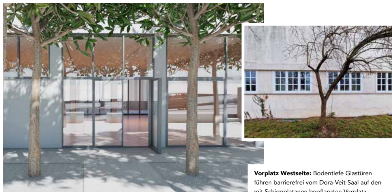
Vorplatz Westseite: Bodentiefe Glastüren führen barrierefrei vom Dora-Veit-Saal auf den mit Schirmplatten bepflanzten Vorplatz.